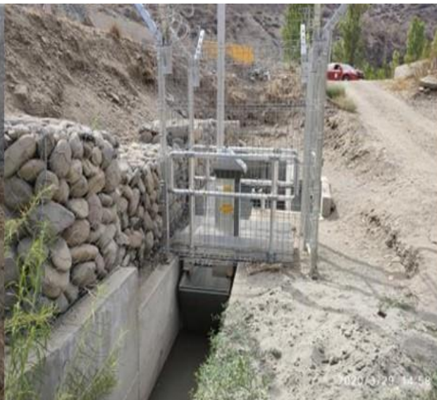
Foto 2. Canal Zamora o Las Vizcachas.