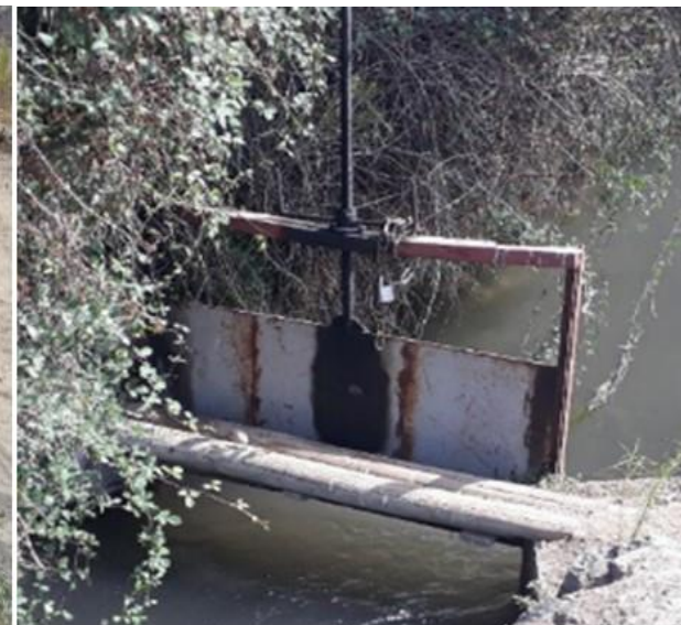
Foto 3. Canal Purehue.