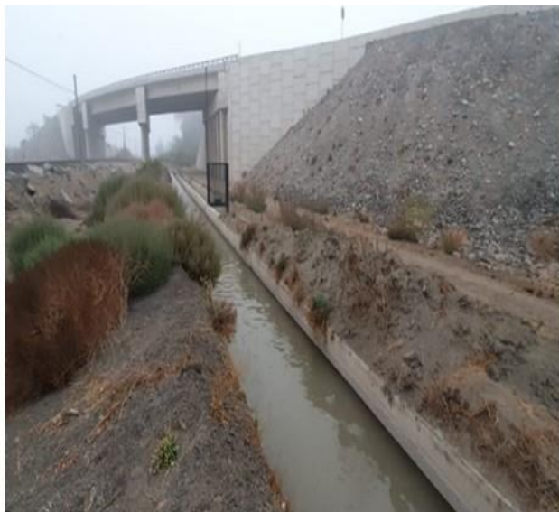
Foto 1. Canal La Pirca.