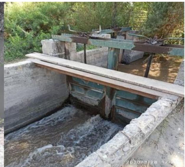
Foto 4. Canal Comunidad Panquehue.